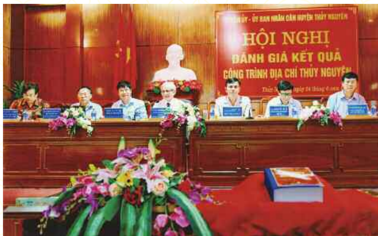
Hội đồng đánh giá kết quả công trình Địa chí Thủy Nguyên

Giám đốc Sở Khoa học và Công nghệ Hải Phòng